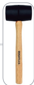
MAZO HULE CLAVE: SP2132-SP2133