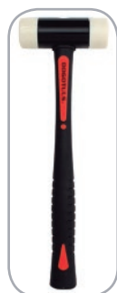
MAZO NYLON CLAVE: TB4030-TB4032

*Opción de mazo (Se venden por separado)