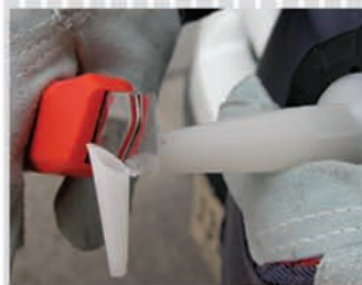
CORTE LA PUNTA DEL CARTUCHO AL TAMAÑO DE SALIDA DESEADO