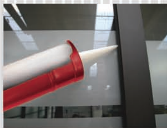
RÁPIDA APLICACIÓN GRACIAS A SU MECANISMO REFORZADO