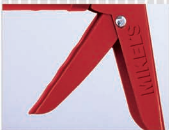
GATILLO DE DISEÑO ERGONÓMICO PARA MEJOR AGARRE