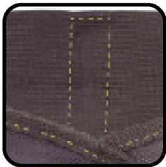
Con 3 varillas plásticas distribuidas en la espalda (dos de 6"x1/2" y una de 6"x1")