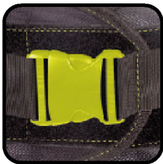
Cinturón para ajuste de gancho - felpa