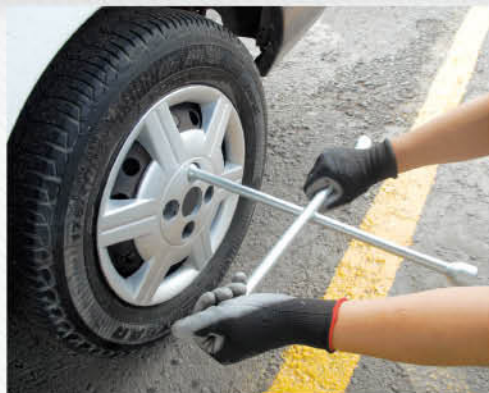
Medidas universales para todo tipo de automóvil.